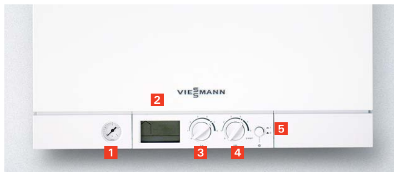
Sistemul de automatizare digital cu sistem de diagnoză

Acumulatorul de 46 litri din oțel inoxidabil încorporat, asigură o productivitate în prepararea apei calde menajere echivalentă cu un boiler cu serpentină de circa 150 litri. Apa caldă vă stă la dispoziție imediat și constant la temperatură reglată, fără fluctuații, chiar dacă doriți să folosiți mai mulți consumatori simultan.