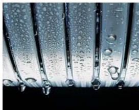
Suprafețele de transfer termic Inox-Radial - fiabile și eficiente

Cazanul în condensatie pe combustibilul gazos Vitodens 111-W reprezintă soluția ideală pentru case unifamiliale. Datorită construcției compacte, acesta se potrivește fără probleme într-o nișă din bucătărie, hol, uscătorie sau oricare altă anexa a locuinței. Modelul Vitodens 111-W este disponibil cu puteri de 19, 26 și 35 kW. Cazanul oferă o performanță sporită la prepararea apei calde menajere, datorită combinației dintre acumulatorul de 46 litri din oțel inoxidabil și schimbătorul de căldură în plăci.