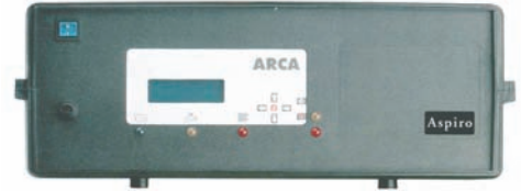
Modul de comanda digital TERMOTRE

rijat către două canale separate: "aer primar" și "aer secundar". Aerul primar determină puterea cazanului și deci consumul de combustibil: mai mult aer = mai multă putere = consum mai mare. Cantitatea de aer primar necesară arderii este corespunzătoare combustibilului utilizat: peleții uscați cer puțin aer primar, peleții mai umezi cer o cantitate de aer primar mai mare. Aerul secundar completează arderea oxidând complet flacăra.